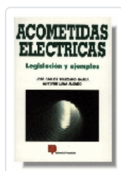
ACOMETIDAS ELECTRICAS TOLEDANO/LUNA