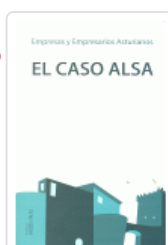
CASO ALSA OCAMPO-SUAREZ