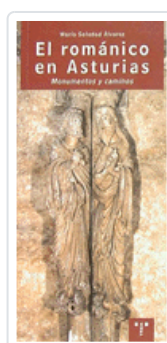
ROMANICO EN ASTURIAS ALVAREZ