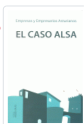
CASO ALSA OCAMPO-SUAREZ