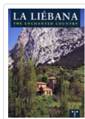
LIEBANA,PAIS ENCANTADO LOPEZ/SANCHEZ/LOZANO