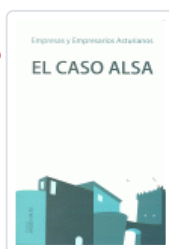
CASO ALSA OCAMPO-SUAREZ