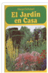
JARDIN EN CASA, EL SCHUBERT