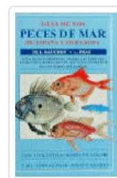
GUIA PECES DE MAR ESP/EUROPA BAUCHOT-PRAS