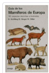
GUIA MAMIFEROS DE EUROPA SCHILLING