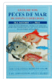
GUIA PECES DE MAR ESP/EUROPA BAUCHOT-PRAS