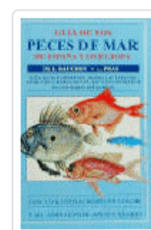
GUIA PECES DE MAR ESP/EUROPA BAUCHOT-PRAS