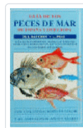
GUIA PECES DE MAR ESP/EUROPA BAUCHOT-PRAS