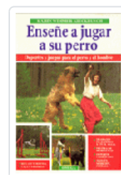
ENSEÑE JUGAR A SU PERRO WIMMER-KIECKBUSCH