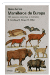
GUIA MAMIFEROS DE EUROPA SCHILLING