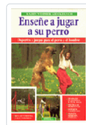
ENSEÑE JUGAR A SU PERRO WIMMER-KIECKBUSCH