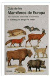
GUÍA MAMIFEROS DE EUROPA SCHILLING