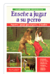
ENSEÑE JUGAR A SU PERRO WIMMER-KIECKBUSCH