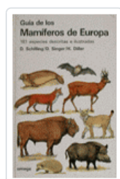
GUÍA MAMÍFEROS DE EUROPA SCHILLING