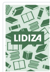
PC AL LIMITE BERTELSONS/RASCH