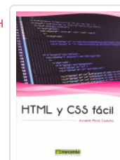
HTML Y CSS FACIL PEREZ CASTAÑO, ARNALDO