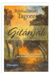
GITANJALI TAGORE, RABINDRANATH