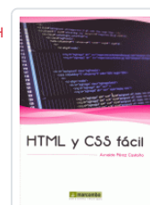
HTML Y CSS FACIL PEREZ CASTAÑO, ARNALDO