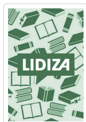
INICIACION A LA METEOROLOGIA LLAUGE