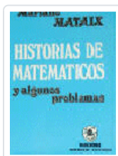
HISTORIAS DE MATEMATICOS MATAIX