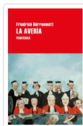
AVERIA DÜRRENMATT, FRIEDRICH