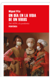
UN DIA EN LA VIDA DE UN VIRUS DEL ADN A LA PANDEMIA PITA, MIGUEL