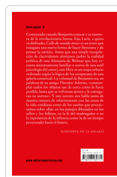
CALLE DE SENTIDO UNICO BENJAMIN, WALTER