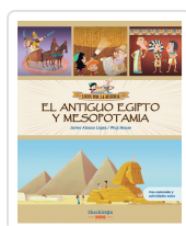
ANTIGUO EGIPTO Y MESOPOTAMIA ALONSO LOPEZ / WUJI HOUSE