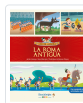
ROMA ANTIGUA ALONSO LOPEZ, AVIER