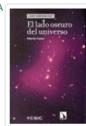
LADO OSCURO DEL UNIVERSO CASAS, ALBERTO