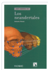
NEANDERTALES ROSAS ANTONIO