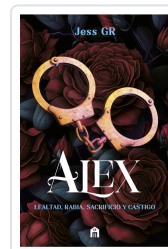
ALEX (CLAN Z, 3) GR, JESS