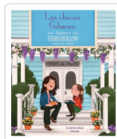
CHICAS GILMORE REGRESO A STARS HOLLOW, LAS MESSINA, CECILIA; OSTOW, MICOL