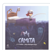
MI CAMITA PINILLOS / RODRIGUEZ RUIZ