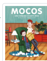
MOCOS UNA SEMANA O SIETE DIAS COPONS / CASTRO