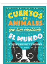
CUENTOS DE ANIMALES QUE HAN CAMBIADO EL MUNDO MARVEL, G.L.