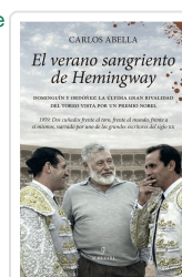
EL VERANO SANGRIENTO DE HEMINGWAY Carlos Abella