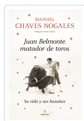
Juan Belmonte, matador de toros Manuel Chaves Nogales