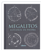
MEGALITOS ESTUDIOS EN PIEDRA AA.VV.