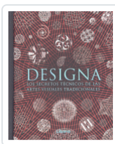
DESIGNIA SECRETOS TECNICOS ARTES VISUALES TRADICIONALES AA.VV.