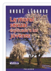
MORAL SEXUAL EXPLICADA A LOS JOVENES ANDRE LEONARD