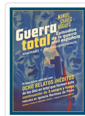
GUERRA TOTAL (RÚSTICA) CHAVES NOGALES, MANUEL