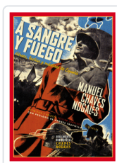
A SANGRE Y FUEGO N/E CHAVES NOGALES, MANUEL