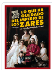
LO QUE HA QUEDADO DEL IMPERIO DE LOS ZARES N/E CHAVES NOGALES, MANUEL