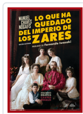
LO QUE HA QUEDADO DEL IMPERIO DE LOS ZARES N/E CHAVES NOGALES, MANUEL