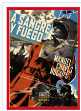
A SANGRE Y FUEGO N/E CHAVES NOGALES, MANUEL