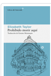
PROHIBIDO MORIR AQUÍ TAYLOR, ELIZABETH