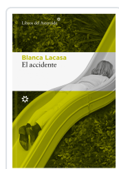
El accidente Lacasa, Blanca