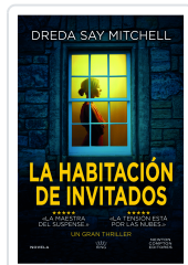
HABITACION DE INVITADOS (BOLSILLO) SAY MITCHELL, DREDA