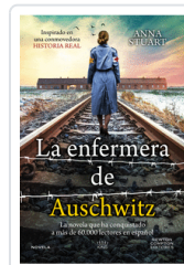
ENFERMERA DE AUSCHWITZ (BOLSILLO) STUART, ANNA