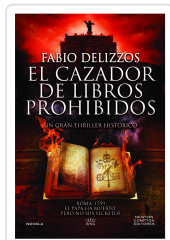
CAZADOR DE LIBROS PROHIBIDOS (BOLSILLO) DELIZOS, FABIO