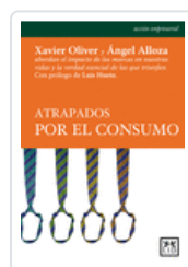
ATRAPADOS POR EL CONSUMO OLIVER CONTI, XAVIER ALLOZA, ANGEL