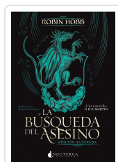
La búsqueda del asesino Hobb, Robin