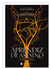
Aprendiz de asesino Hobb, Robin