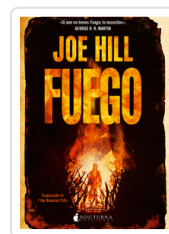
FUEGO HILL, JOE