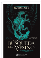
La búsqueda del asesino Hobb, Robin