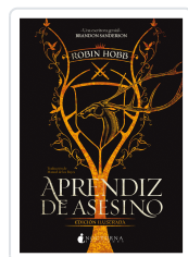
Aprendiz de asesino Hobb, Robin