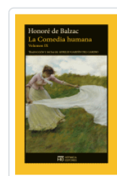
COMEDIA HUMANA (9) BALZAC, HONORE