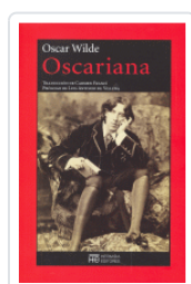
OSCARIANA WILDE, OSCAR