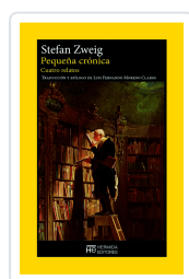
PEQUEÑA CRÓNICA ZWEIG, STEFAN