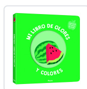
MI LIBRO DE OLORES Y COLORES. FRUTAS DELICIOSAS AA.VV.