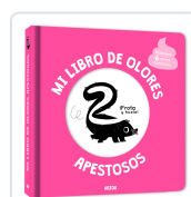
MI LIBRO DE OLORES Y COLORES. APESTOSOS Mr. Iwi