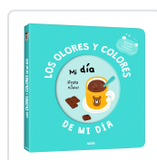
MI LIBRO DE OLORES Y COLORES. MI DIA MR. IWI