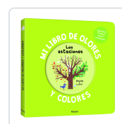
MI LIBRO DE OLORES Y COLORES. LAS ESTACIONES Mr. Iwi