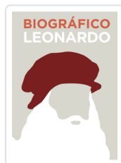
BIOGRAFICO LEONARDO (OFERTA) KIRK, ANDREW