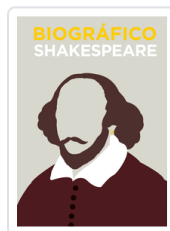
BIOGRAFICO SHAKESPEARE (OFERTA) CROOT, VIV