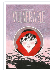
VULNERABLE CASTREE, GENEVIEVE