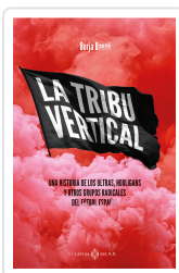
TRIBU VERTICAL BAUZA, BORJA