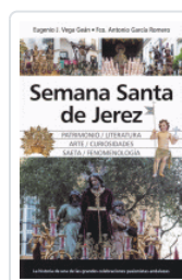
SEMANA SANTA DE JEREZ