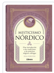
MISTICISMO NÓRDICO FORVITIN, DISA