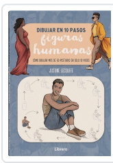
DIBUJAR FIGURAS HUMANAS EN 10 PASOS LECOUFFE, JUSTINE