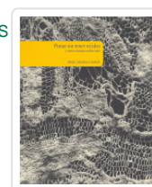
PINTAR SIN TENER NI IDEA Y OTROS ENSAYOS SOBRE ARTE (R) GONZALEZ GARCIA, ANGEL