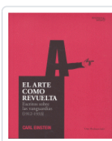
ARTE COMO REVUELTA: ESCRITOS SOBRE LAS VANGUARDIAS 1912-1933 EINSTEIN, CARL