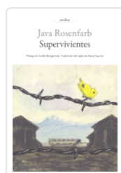
SUPERVIVIENTES ROSENFARB, JAVA