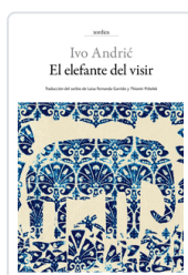
ELEFANTE DEL VISIR ANDRIC, IVO