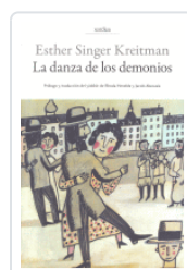
DANZA DE LOS DEMONIOS SINGER KREITMAN, ESTHER