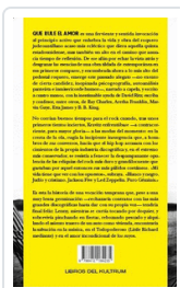
QUE RULE EL AMOR KRAVITZ, LENNY