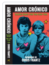
AMOR CRONICO MEMORIAS DE FRANTZ, CHRIS