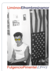
HOMBRE SIN AMOR LIMONOV, EDUARD