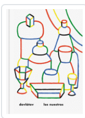
LOS NUESTROS DOVLATOV, SERGUEI