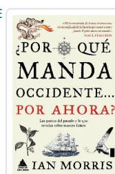
POR QUE MANDA OCCIDENTE POR AHORA MORRIS, IAN