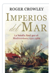
IMPERIOS DEL MAR CROWLEY, ROGER