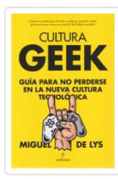
CULTURA GEEK GUÍA PARA NO PERDERSE EN LA NUEVA CULTURA TECNOLÓGICA DE LYS, MIGUEL