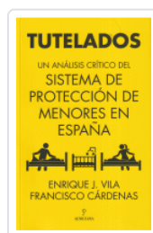
TUTELADOS VILA / CARDENAS