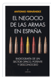
NEGOCIO DE LAS ARMAS EN ESPAÑA FERNÁNDEZ, ANTONIO