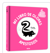
MI LIBRO DE OLORES APESTOSOS Mr. Iwi