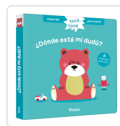
HISTORIAS PARA TOCAR. TOCA. ¿DÓNDE ESTÁ MI DUDU? LIBRO CON TEXTURAS PARA B Chatel, Christelle