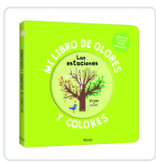
MI LIBRO DE OLORES Y COLORES. LAS ESTACIONES Mr. Iwi