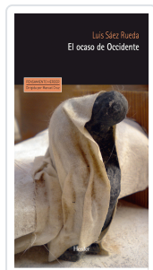
OCASO DE OCCIDENTE, EL SAEZ RUEDA, LUIS