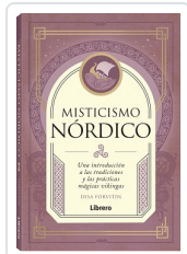
MISTICISMO NÓRDICO FORVITIN, DISA