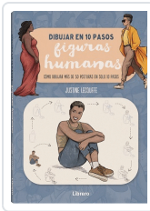
DIBUJAR FIGURAS HUMANAS EN 10 PASOS LECOUFFE, JUSTINE