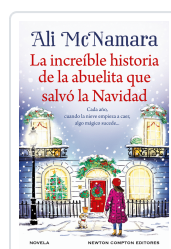
INCREIBLE HISTORIA DE LA ABUELITA QUE SALVO LA NAVIDAD MCNAMARA, ALI