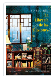
LA LIBRERÍA DE LAS ILUSIONES SO, SEO-RIM