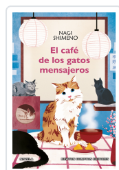
EL CAFE DE LOS GATOS MENSAJEROS SHIMENO, NAGI