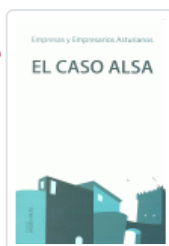
CASO ALSA OCAMPO-SUAREZ