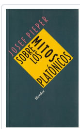
SOBRE LOS MITOS PLATONICOS PIEPER, JOSEF