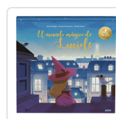
EL MUNDO MÁGICO DE LUCIOLE. LIBRO LUMINOSO EN 3D. FILIPPINI, ANOUK