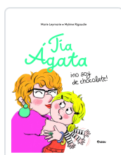
TÍA ÁGATA, NO SOY DE CHOCOLATE MARIE LEYMARIE MYLENE RIGAUDIE